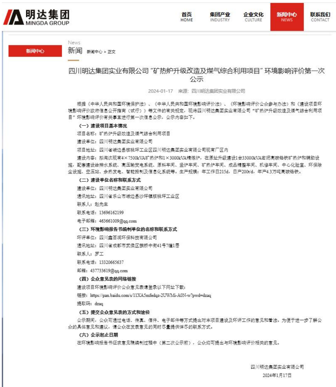
图 2-1 项目首次环境影响评价信息公开公示截图