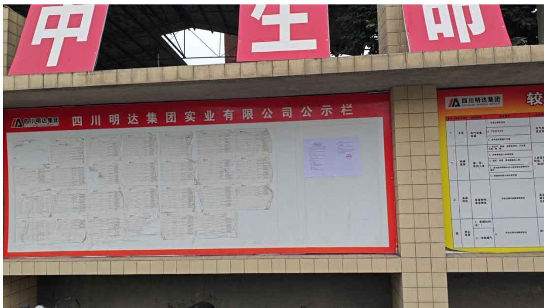
图 3-4 项目粘贴公示