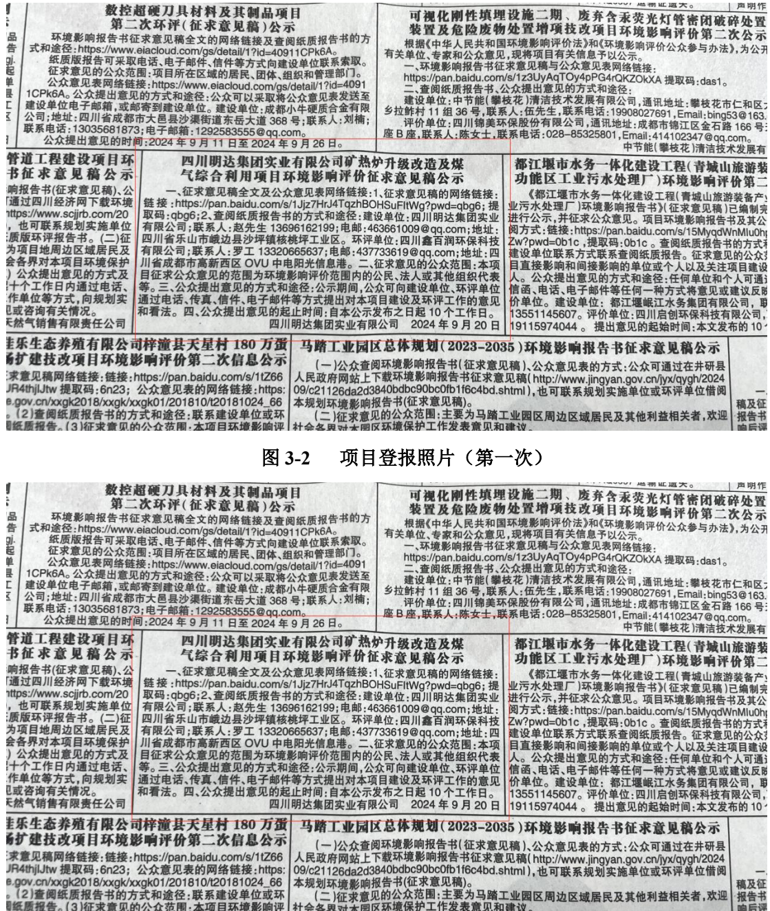
图 3-2 项目登报照片 (第一次)